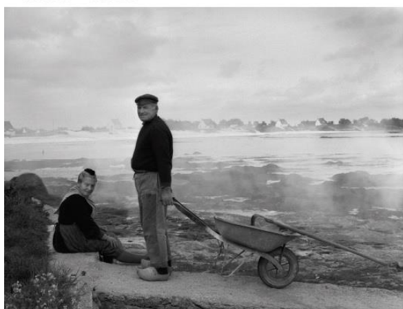
Wystawa w ramach XXIII Dni Bretanii / Program: www.dombretanii.org.pl