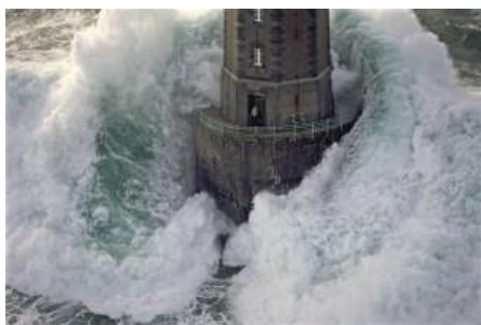
La Jument